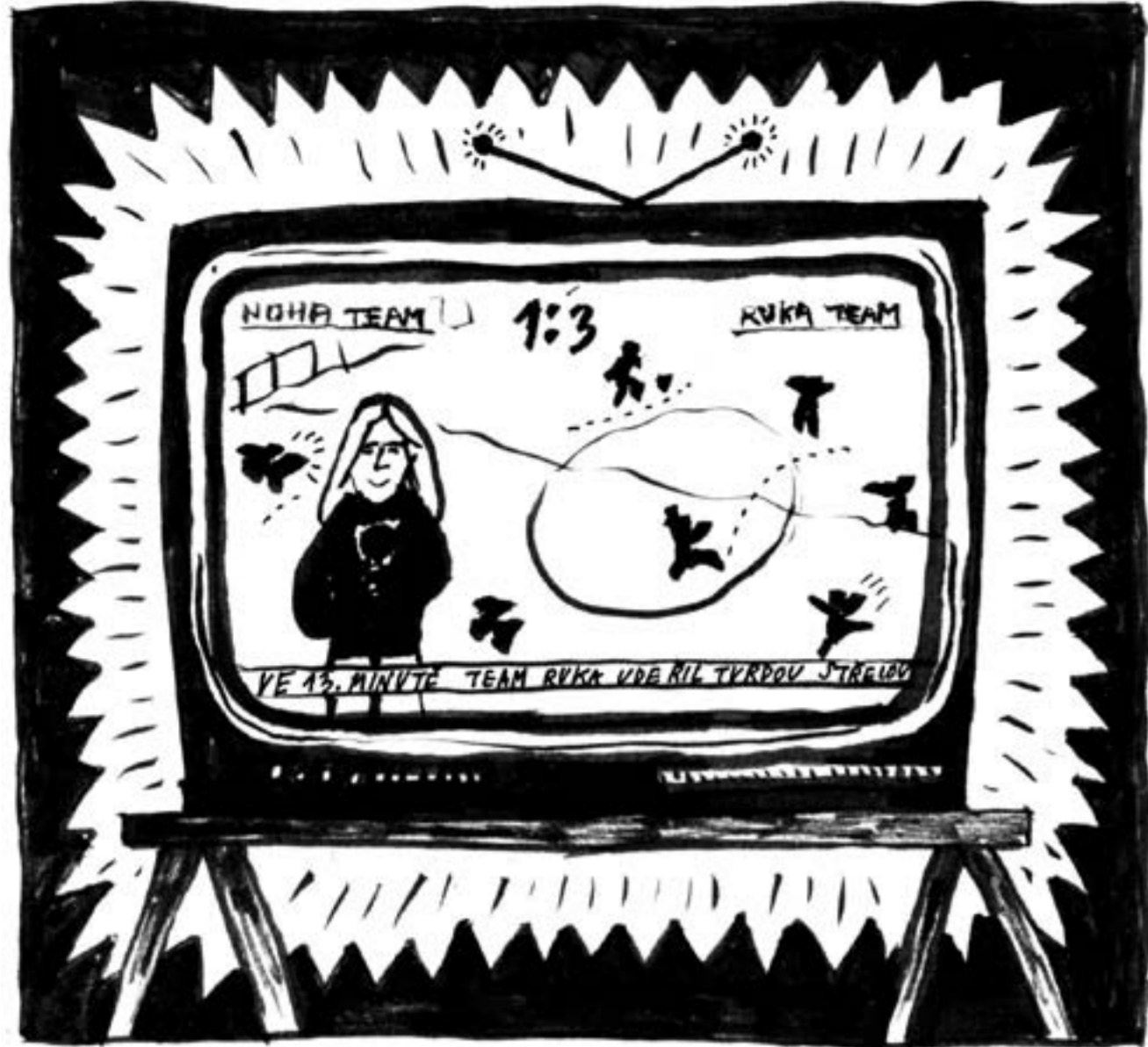
Televize - Jakub Bachofík