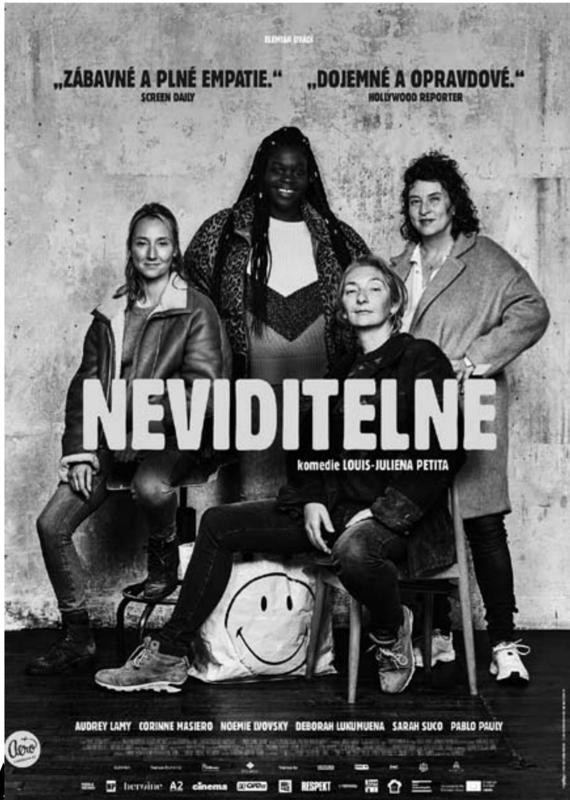
Poster zdroj on-line, distribuce Aerofilms