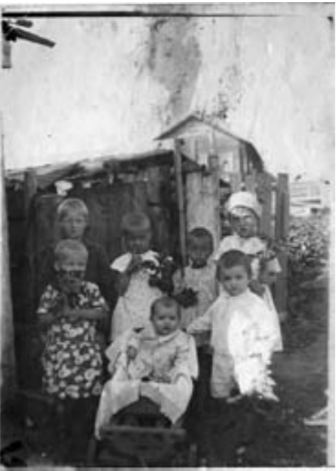
Děti před dřevníkem

V mrazech u velké místní studny byla vždycky dlouhá fronta, dlouho se čekalo. Vodu