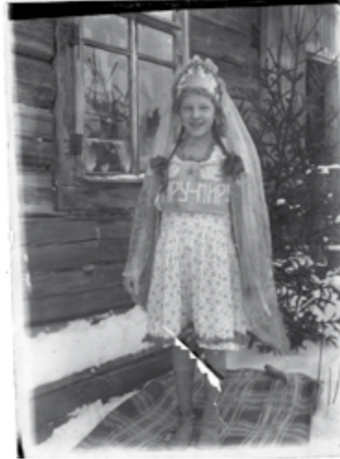
Míru mir – Maškarní