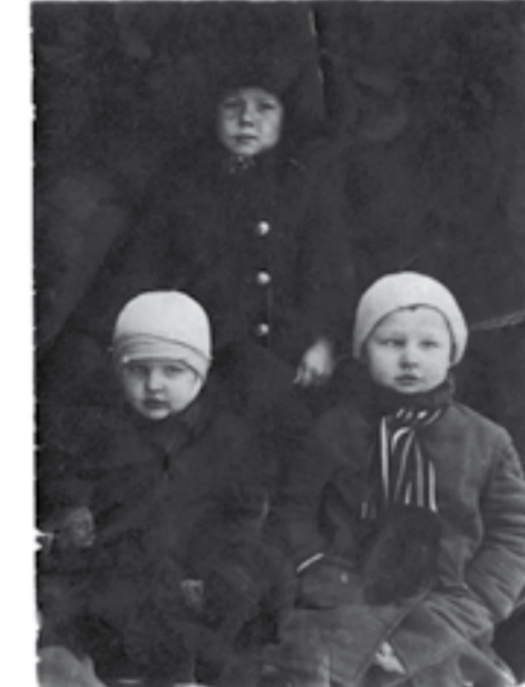
zimní měsíce v Archangelsk

ly. Strava byla chutná, ve školce se mi líbilo. V roce 1946 ale školku zavřeli, zůstala jsem doma s dědečkem. V zimě jsem seděla na peci, protože byly tuhé mrazy. Neměla jsem válečky, tak jsem vždycky čekala, až sestra přijde ze školy a dá mi ty svy. Vyšla jsem vždycky na dvůr podívat se, kolik je sněhu, bylo ho hodně. Venku bylo mrazivo, den byl mrazivý, zima byla dlouhá. Seděla jsem pořád na peci a prohlížela si jednu dětskou knížku, byly v ní obrázky různých zvířátek, byla to jediná knížka, kterou jsme měli, přivezla nám ji jedna paní. Hračky taky nebyly, měla jsem jednu hadrovou panenku, kterou ušila ručně jedna švadlena, šaty nešila, protože nebyly látky, přišly až po válce. Dopoledne jsem poslouchala zprávy z rozhlasu, to bylo takové kulaté rádio, kterým jsem nerozuměla a pak už nic. Tak jsem se zabavovala sama, zpívala jsem písničky, recitovala jsem básničky, které jsem se naučila ve školce. Měly jsme kocoura, zrzavého kocoura, jmenoval se Vaska. Ten seděl se mnou na peci, pro mě to byl dobrý společník. Společně