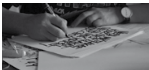
workshop s Toy Box