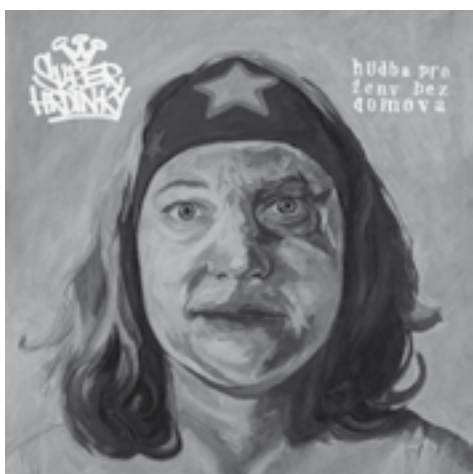
obal desky vytvořila Toy Box a ženy z Jako doma