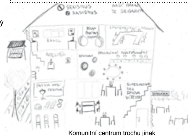
Komunitní centrum trochu jinak

Přijďte společně oslavit Vánoční svátky sice na ulici, ale s dobrým jídlem na talíři!