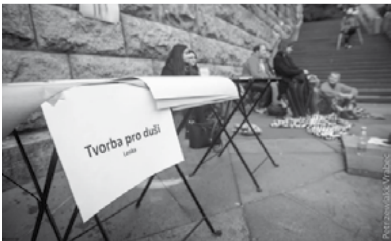
Malování stínového já