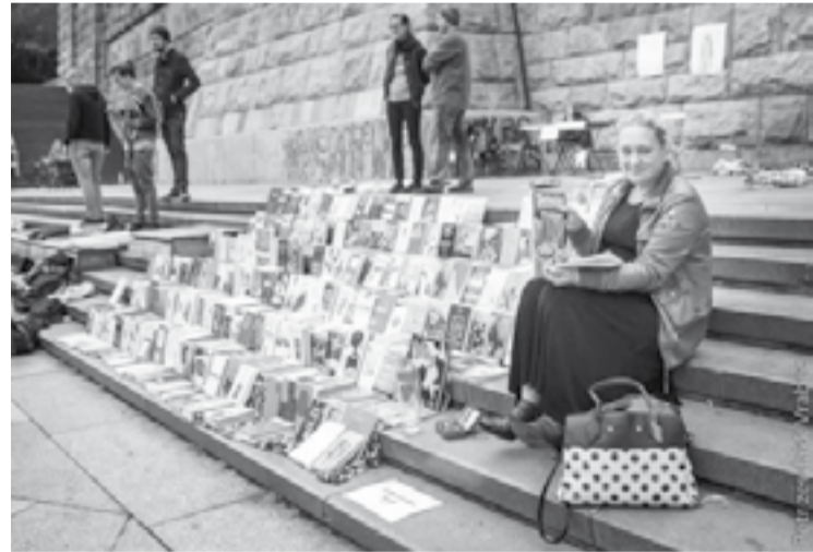
Pouliční knižní bazar