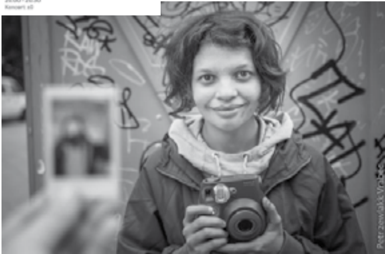
Momentka fotografky s polaroidem, která zachycovala auru návštěvníku