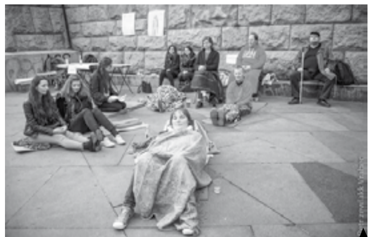
Imaginace bezpečného místa