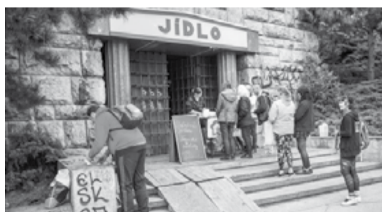
Fronta na palačinky a polívku od kuchařek bez domova