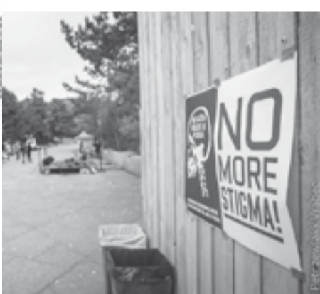
Už žádné stigma!